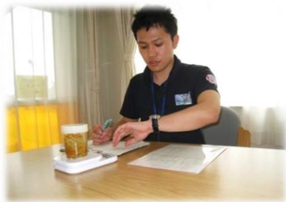
食品を収去しているところ

食中毒が発生したり、窓口対応に忙殺されるときもありますが、基本的には年間計画に基づいて業務がすすめられるため働きやすいです。