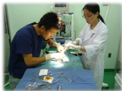
猫の不妊去勢手術