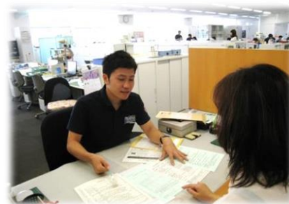
来所された市民への説明中