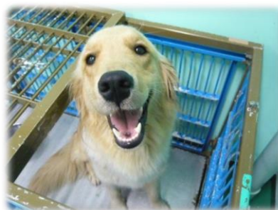
センターに収容された迷子犬